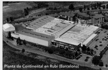
Planta de Continental en Rubí (Barcelona)

De esta forma, se crea un caldo de cultivo que motiva el replanteamiento constante de todos los procesos, logrando además la implicación de los 440 profesionales que forman el equipo humano de la compañía. De hecho, el año pasado la planta logró la segunda posición del grupo en proposición de ideas, y este año tiene previsto