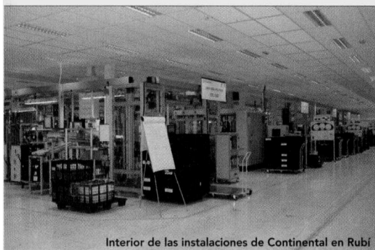
Interior de las instalaciones de Continental en Rubí

La compañía VDO se fundó en 1987 en Rubí (Barcelona), iniciando su actividad como proveedor de cuadros de instrumentación para Seat. A lo largo de su trayectoria ha diversificado su cartera de clientes, formada en la actualidad por los grupos Volkswagen, PSA, BMW y Fiat. Paralelamente, ha pertenecido a diversas corporaciones hasta que en 2007 se integró en la multinacional Continental, formando parte de su unidad de negocio de Instrumentación y Displays, dentro de la división de Interiores.