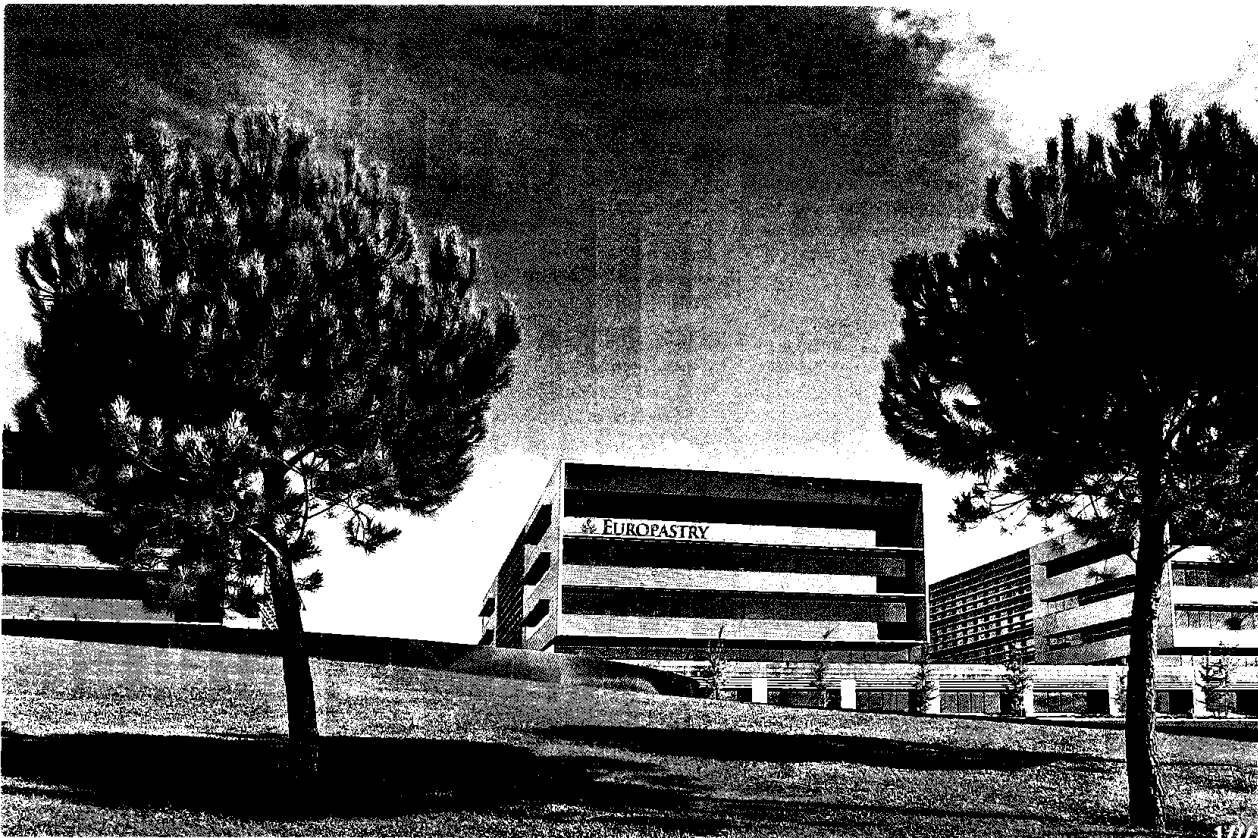
1/// EUROPASTRY. L'EMPRESA TÉ LA SEVA SEU CENTRAL A SANT CUGAT DEL VALLÈS